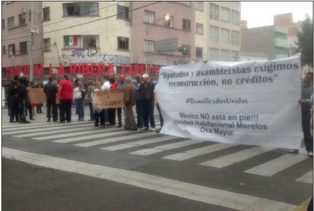
9 de noviembre de 2017, en la Delegación Cuauhtémoc.